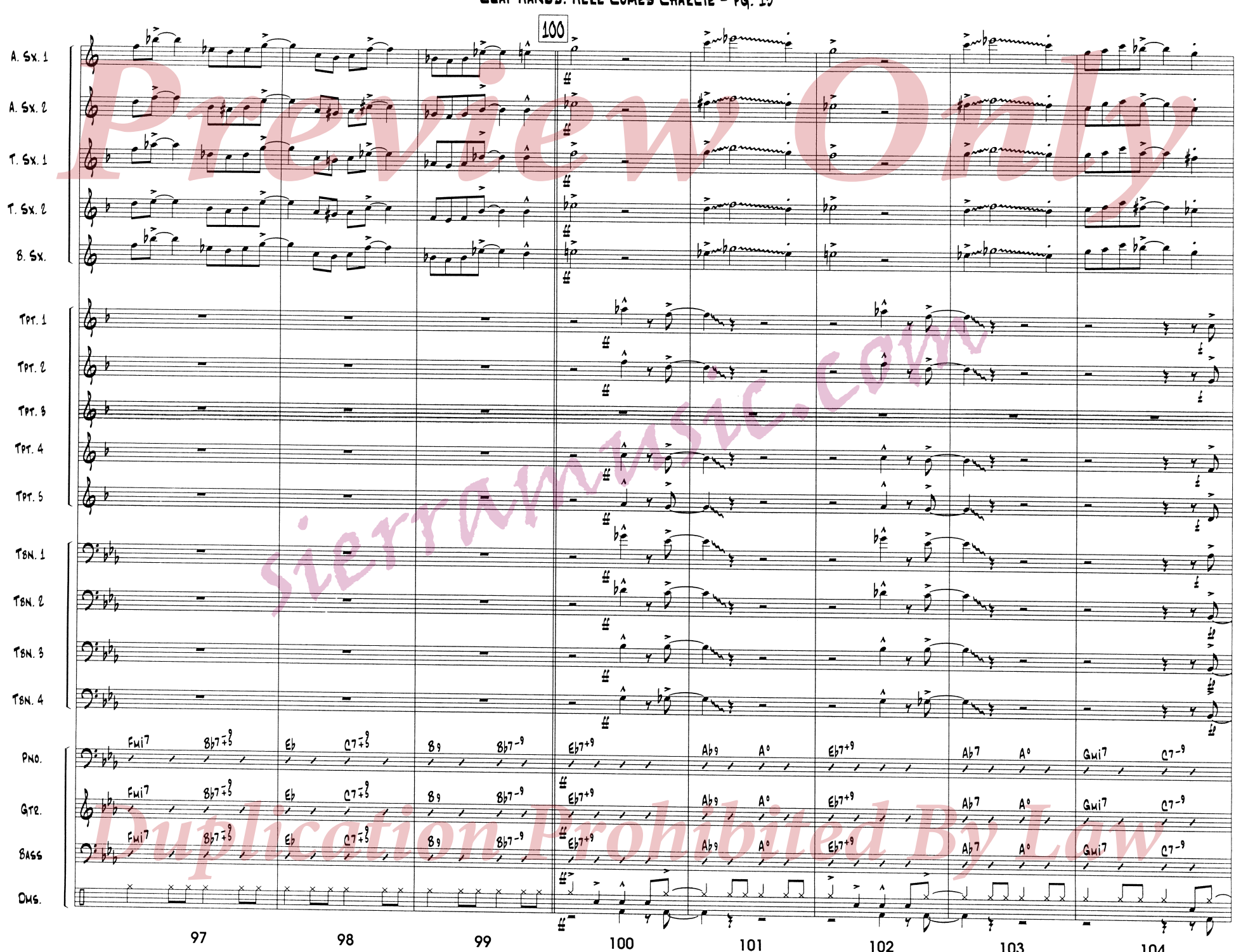
CLAP HANDS! HERE COMES CHARLIE - PQ. 13